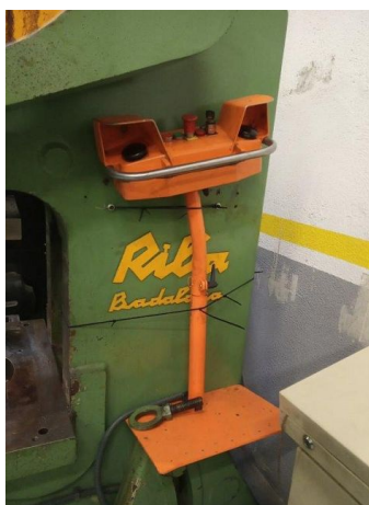
2 hand pedistal