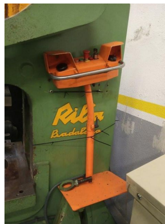
2 hand pedistal